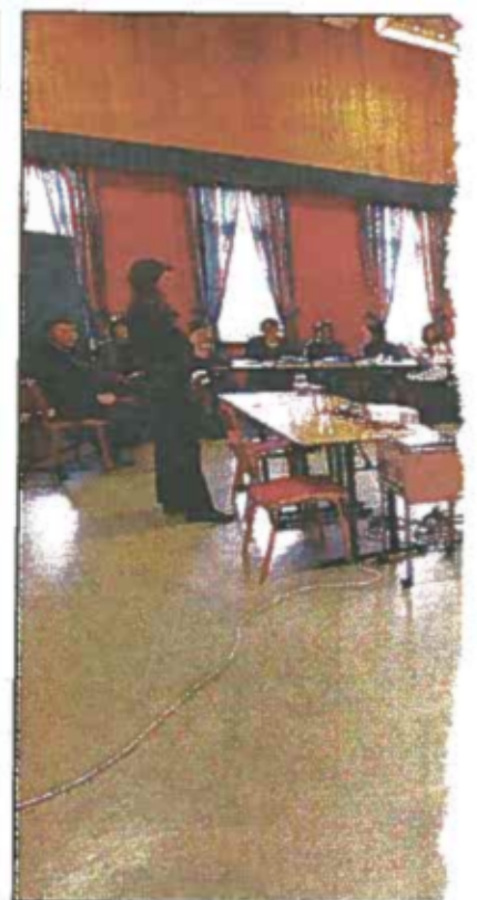
37 studenter fra seks kommuner st